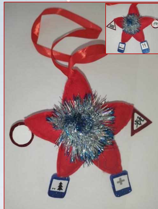
«Звезда знаков ПДД»