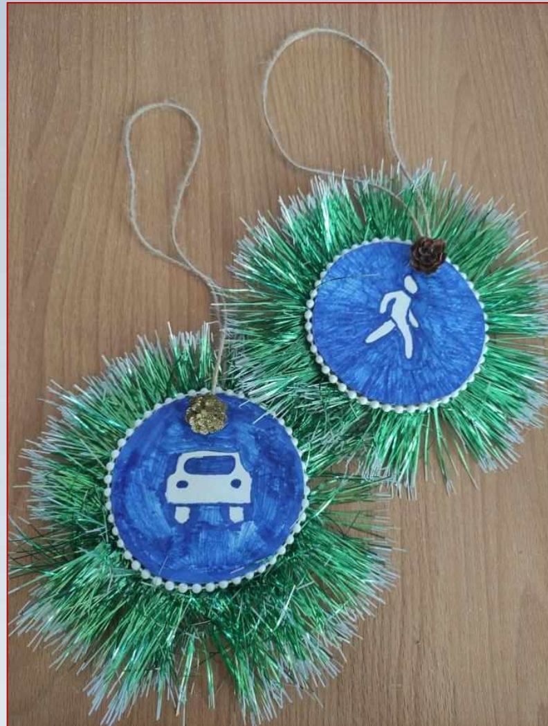
«Дорожный знак на новогодней елке»