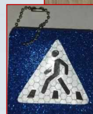
«Пешеходный переход» (фликер)